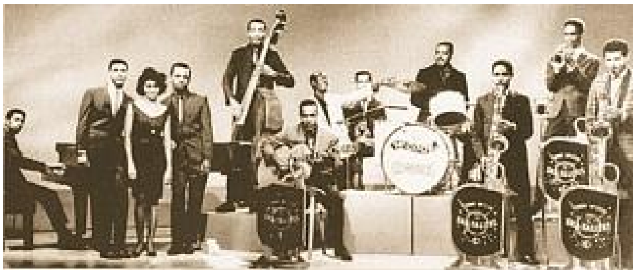
Ska. The Skatalites - Guns Of Navarone, Phoenix City, Addis Ababa, Blackberry Brandy, Smiling. Prince Buster – Madness, Al Capone, One Step Beyond. The Folkies Brothers – Oh Carolina. Desmond Dekker – Get Up Edina. The Ethiopians – Train To Skaville. Theophilus Beckford – Easy Snappin'. Jimmy Cliff – Miss Jamaica.