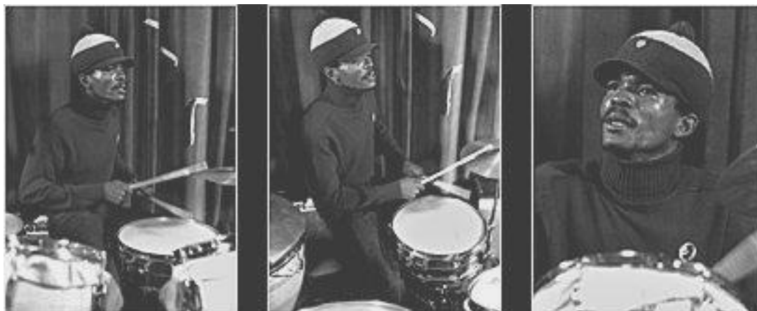
Carlton "Carly" Barrett.

Le soir du 17 avril 1987, Barrett, un homme tranquille et introverti qui n'aimaient pas se mettre en avant, est assassiné devant chez lui par deux balles dans la tête. Peu après, la police Jamaïcaine arrête la femme de Barrett, son amant et un troisième homme. Sa femme et son amant sont accusés de meurtre. Ils échappent aux charges mais sont inculpés sur des charges de conspiration. Ils ne passent qu'un an en prison.