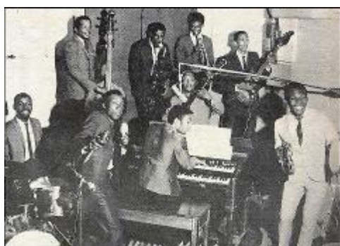
The Soul Vendors avec Bunny Williams.

Mickey "Boo" Richards. A remplacer Carlton Barrett dans The Upsetters lorsque celui-ci part pour jouer Avec Bob Marley & The Wailers. Joue sur les titres "So Much Trouble" and "Ride Natty Ride" de l'album "Survival" de Bob Marley & The Wailers. A également joué avec Pablo Moses Jacob Miller et Jimmy Cliff