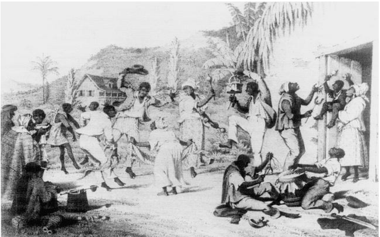
Peinture très stéréotypée d'une danse des esclaves.

Pour les colons, les esclaves ne peuvent pas être "à l'hauteur" des bonnes grâces européens, et ne font qu'une copie pitoyable des bonnes manières sociales et culturelles des blancs. Ils ne voient pas que les esclaves poussent au ridicule les manières et prétentions de blancs se moquent discrètement de leurs maîtres!