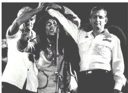
Michael Manley, Bob Marley & Edward Seaga. One Peace Concert Kingston. 22 avril 1978.

En 1975 il y a une imposition d'embargo sur l'approvisionnement en pétrole de l'île. Pour empirer encore plus la situation d'instabilité, l'économie mondiale est en dépression. Cette situation très tendue précède les élections de 1976. La crise finit presque en guerre civile, et le chaos règne. Les partisans du JLP font tout pour rendre la situation politique intenable. Des gangs armés s'entretenant dans les bidons villes de Kingston. Malgré cette situation extrême, le PNP remporte les élections une deuxième fois. Le CIA et le gouvernement Américain n'apprécie pas la politique socialiste de Michael Manley et le PNP, surtout lorsque Manley noue relations étroites avec le Cuba socialiste de Fidel Castro, leur arche ennemi. Les investisseurs étrangers quittent le pays en masse, et l'économie et surtout le tourisme, se trouvent au plus mal. Le pays est presque en état de siège. 700 personnes sont tuées en amont des élections de 1980, qui est gagné par Edward Seaga et le JLP. L'économie et les relations internationales sont restaurées sous son régime.